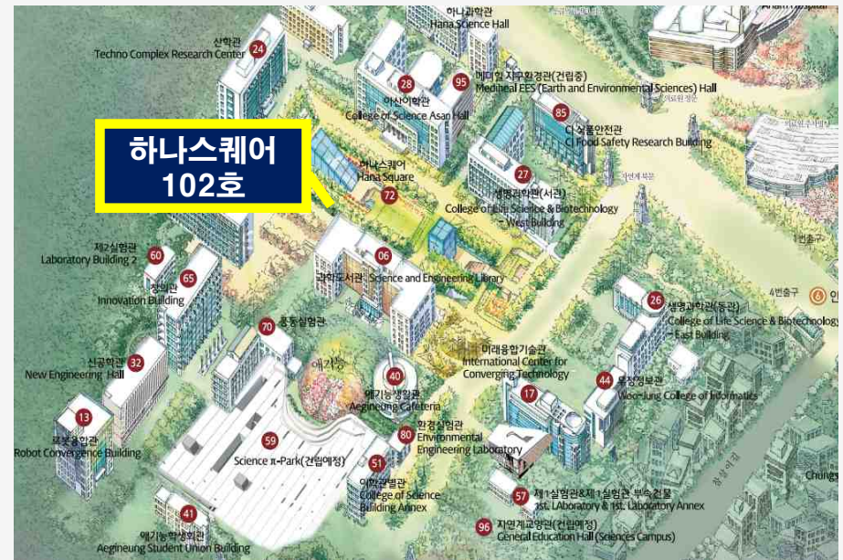
자연계 캠퍼스 (하нас퀘어 102호)