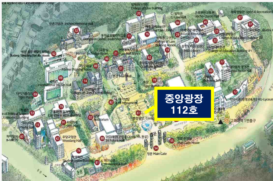
인문사회계 캠퍼스 (중앙광장 112호)