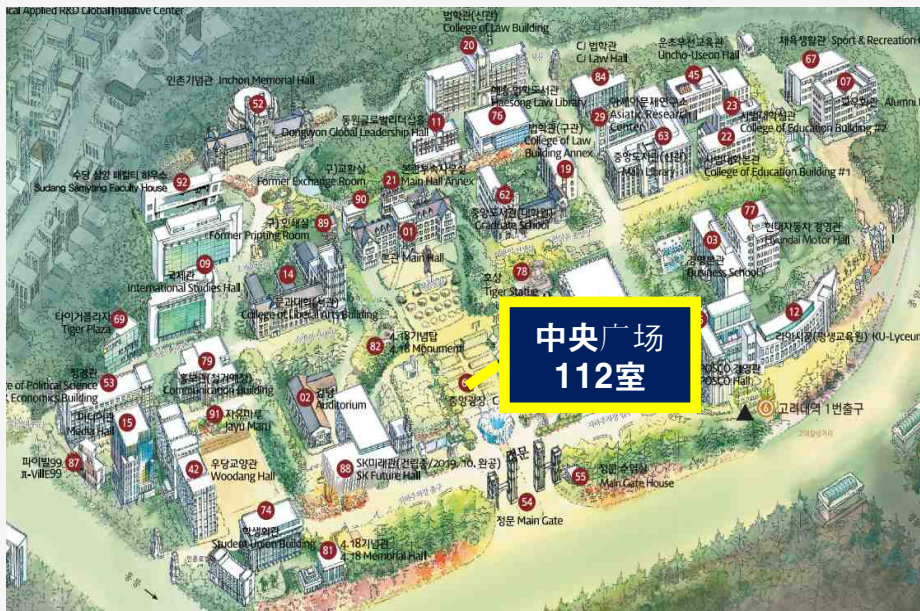
人文社会 校园 (中央广场 112室)