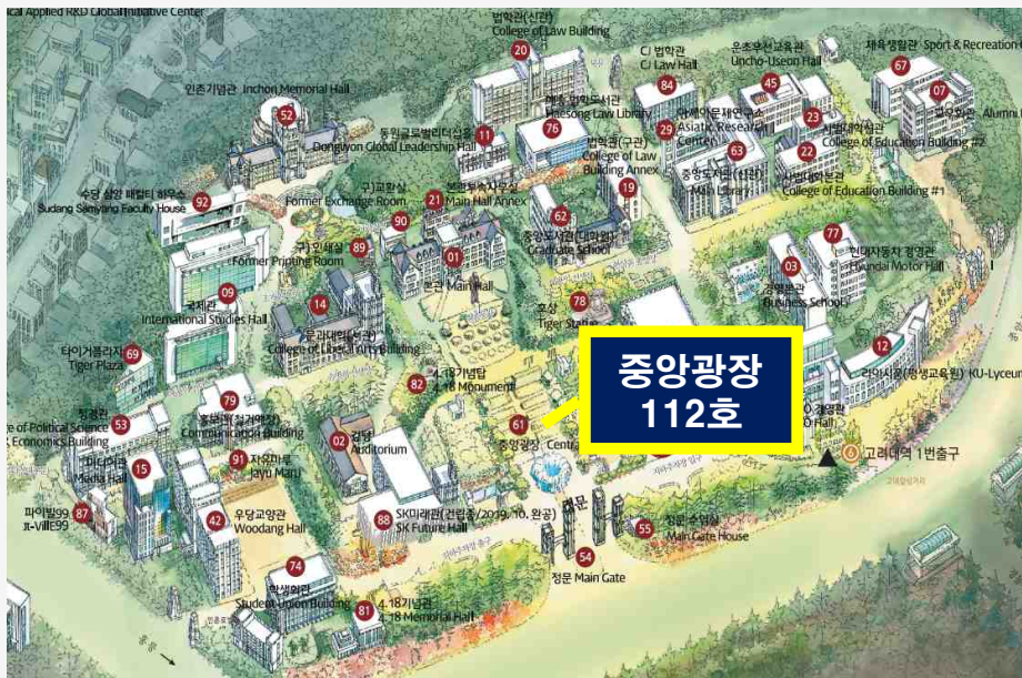
인문사회계 캠퍼스 (중앙광장 112호)