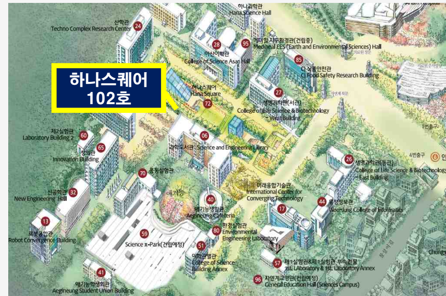
자연계 캠퍼스 (하나스퀘어 102호)